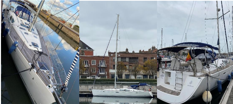
« Cléon » océanis 50

Unique dans les hauts de France , le club croisière se veut loueur de voiliers et de bateaux moteurs pour les touristes et le loisir. Dunkerque est une base de départ idéale pour Londres , les mers intérieures des Pays-Bas , ou même une escapade vers les caps Gris Nez et Blanc Nez .